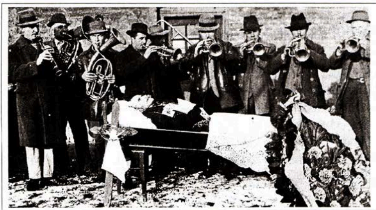
Dechovka před válkou hraje na pohřbu

men; v hospodě u taska. Pínes je na stejném místě hospoda (mezi postou a pekařstvím na návsi).