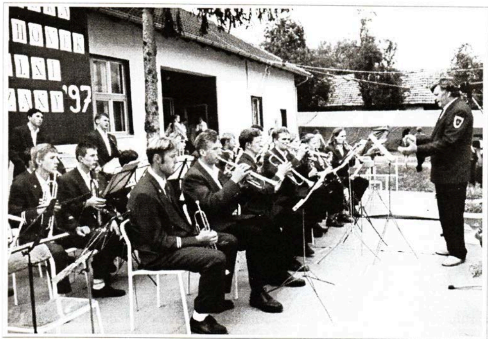
Končenicí dechovka v roce 1997

Končenicí dechovka hraje stále. Vystupuje na různých přehlídkách a v programech organizovaných Svazem Čechů a Českou besedou Končenic. Je všude vítána.